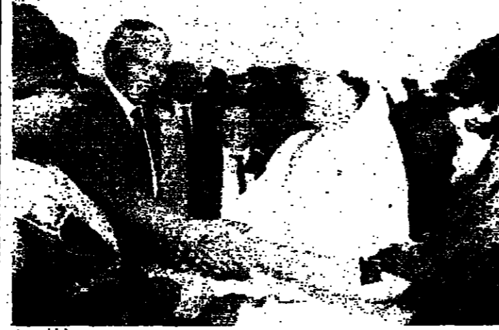
اللقاء وعقبه برحيل مانديلا وزوجته